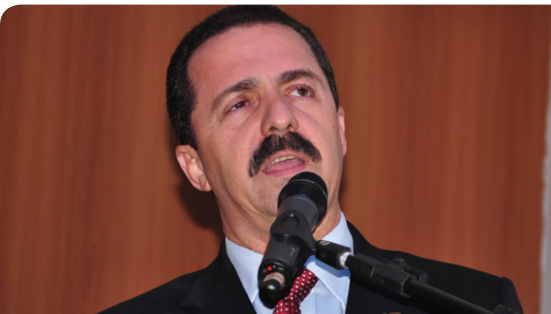
O deputado Itamar Borges preside a Frepem

Também, ainda segundo o deputado Itamar, o grande salto seria a criação da Subsecretaria Estadual das Micro e Pequenas Empresas e a aprovação da proposta apresentada à Secretaria da Fazenda do Estado para a recuperação dos benefícios que havia no Simples Paulista e que foram perdidos com o Simples Nacional, como a isenção de ICMS para Micro Empresa e mecanismo de transição de alíquota para Pequenas Empresas. A proposta está em análise. ■