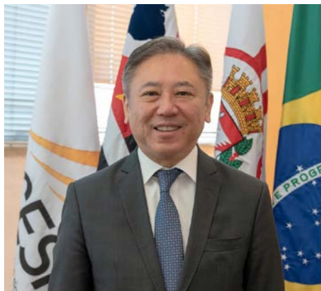
Walter Iihoshi Presidente da Jucesp

No dia do evento em dezembro estavam presentes a diretora do Banco Mundial, Paloma Casero, e os patrocinadores do estudo, a Confederação Nacional do Comércio (CNC), o Serviço Brasileiro